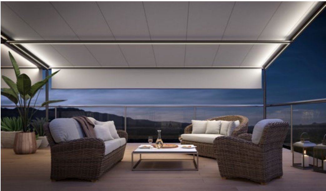
markilux Schattenplus und LED-Beleuchtung