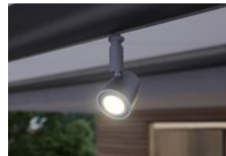
LED-Spots am Tuchstützrohr