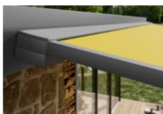
Eckige, geschlossene Vollkassette

Extras für mehr Schatten, Licht und Wärme – entdecken Sie alle Möglichkeiten der Individualisierung bei Ihrem markilux Fachpartner und auf markilux.com